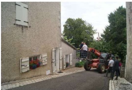
Des mobiliers urbains ont été posés, remplacés, nettoyés