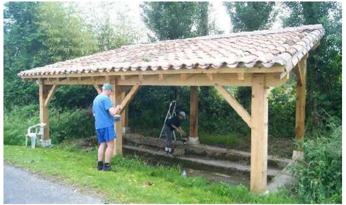
Le lavoir a été lasuré