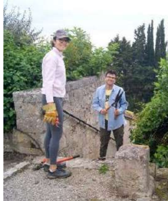
Taille des haies et entretien des massifs