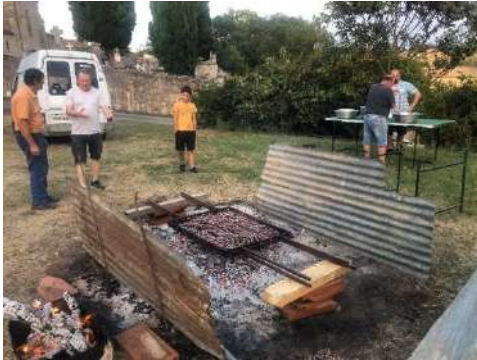
Repas annuel du club le 29/07/2023