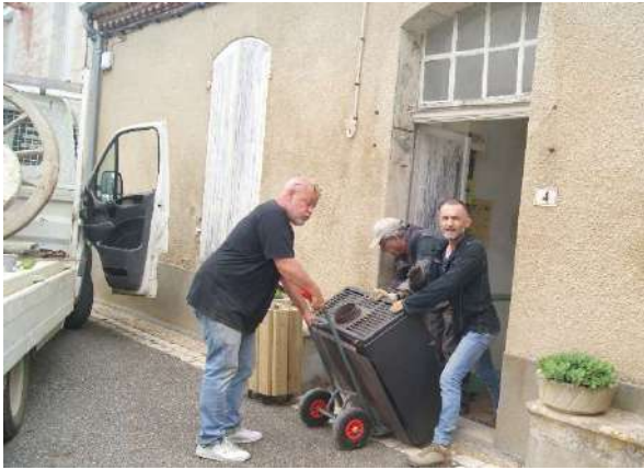
Le presbytère a été désencombré