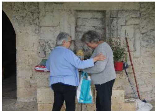
Ménage et travaux d'entretien aux abords de la chapelle de Las Martres