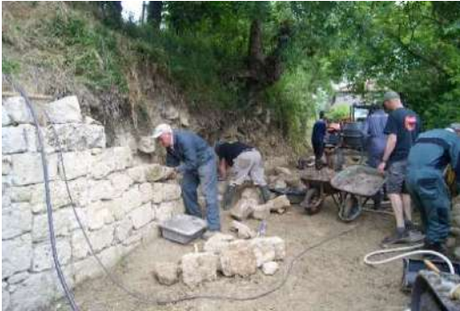
Une nouvelle section du mur du chemin des rondes a été rebâtie