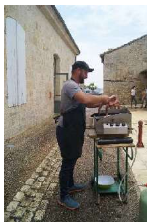
Un apéritif suivi d'un repas est venu clore ce moment de convivialité, de partage et d'effort collectif.