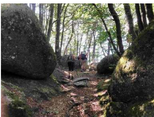
Séjour rando dans massif du Sidobre du 8 au 10 septembre 2023