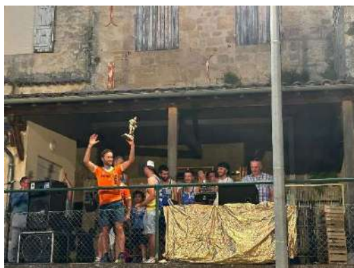
Une partie de l'équipe des bénévoles