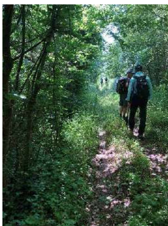
Séjour rando dans le Berry du 31 mai au 4 juin 2023