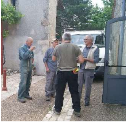
Accueil café pour débiter cette journée

Poursuivant le labeur de 2022, plusieurs équipes se sont affairées à différentes missions dans le village