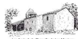
Les Amis de la Chapelle de Las Martres