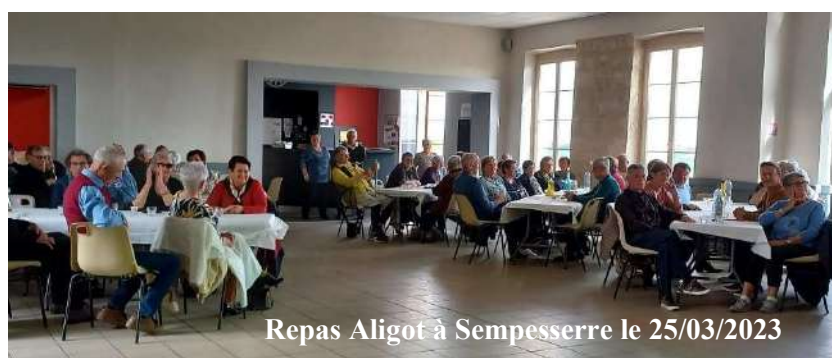
Repas Aligot à Sempesserre le 25/03/2023