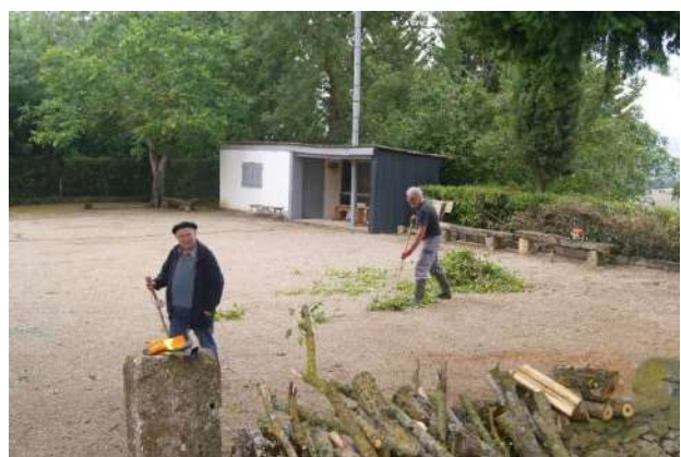
Le terrain de pétanque a également été nettoyé et un escalier a été mis au jour