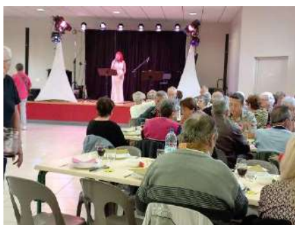
Repas d'automne à Gimbrède le 21/10/2023