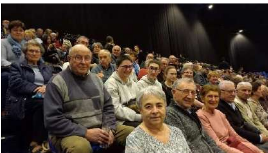
Spectacle Les Bodin's au Zénith de Toulouse le 04/03/2023