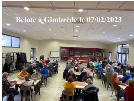
Belote à Gimbrède le 07/02/2023