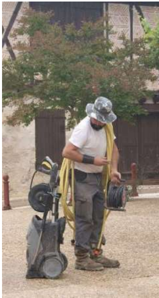
La place devant la salle des fêtes a retrouvé son éclat